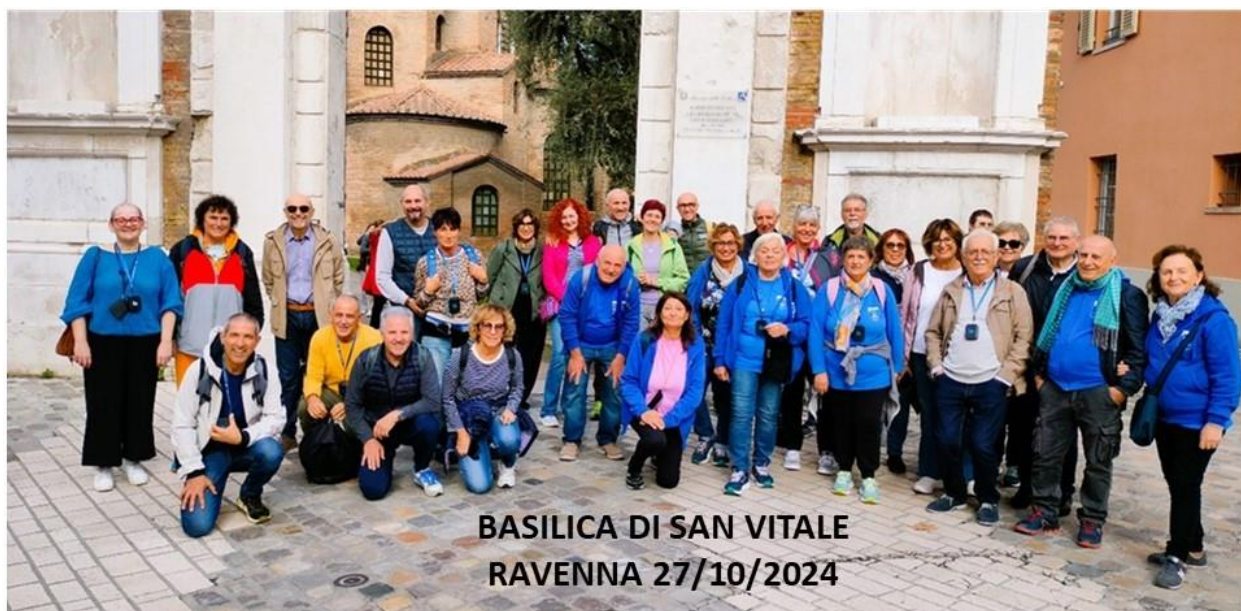
BASILICA DI SAN VITALE RAVENNA 27/10/2024

È di nuovo possibile associarsi a La Pedivella 1995 per tutte le attività di Cammino, Ciclismo, Nordic Walking, Pallavolo, Burraco; Per praticare ginnastica posturale e le attività sportive alla Polisportiva Stella, con la quale in atto un accordo di collaborazione, è necessario il doppio tesseramento, pressoché allo stesso costo, per ragioni amministrative e assicurative